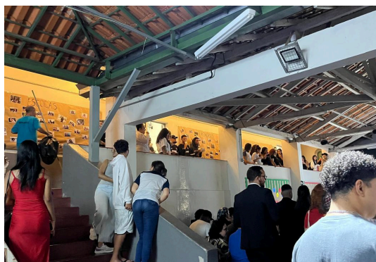
Painel de fotos dos alunos e bastidores das Oficinas

Data: 03/12/2024