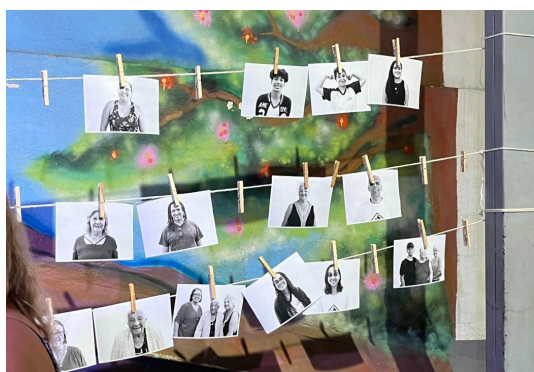
Varal de fotos oficiais dos participantes do Projeto

Data: 03/12/2024