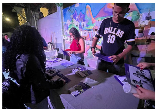
Distribuição das fotos oficiais, catálogo e ímãs do Projeto

Data: 03/12/2024