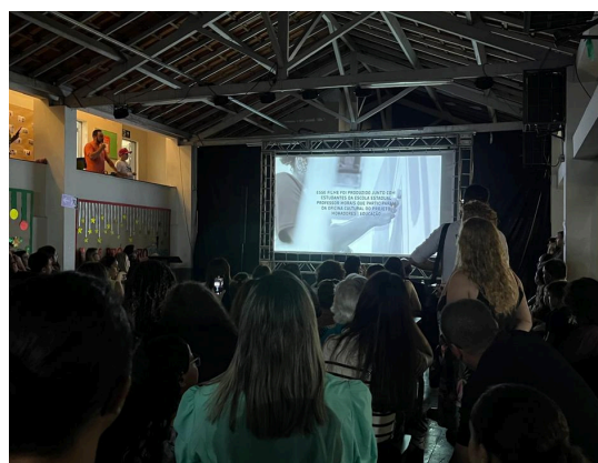
Exibição do documentário produzido no Projeto Autoria: Natália Morita Data: 03/12/2024