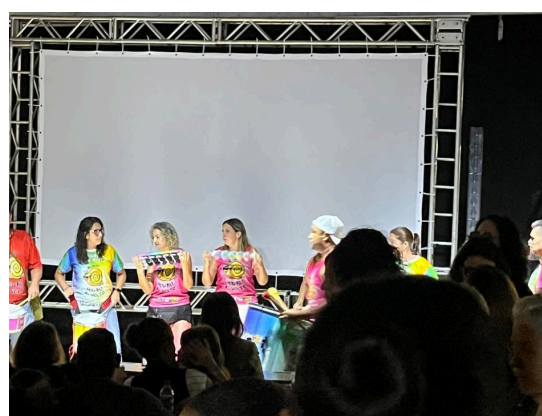
Apresentação da banda do bloco de carnaval “Vou Ali e Volta” Autoria: Natália Morita Data: 03/12/2024