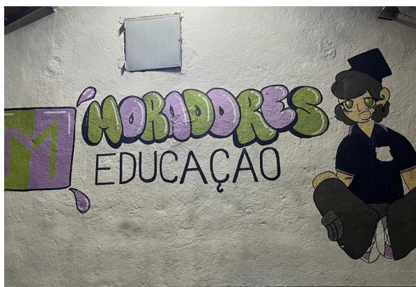
Grafite feito pelos alunos em uma parede do pátio com o nome do Projeto Autoria: Natália Morita Data: 03/12/2024

No pátio de entrada da Escola, em uma parede lateral, foi feito pelos alunos da Escola um grafite com o nome do Projeto e uma ilustração. Próximo ao portão de acesso ao pátio interno da escola havia um cartaz / banner que trazia uma breve apresentação do projeto, bem como os parceiros envolvidos.