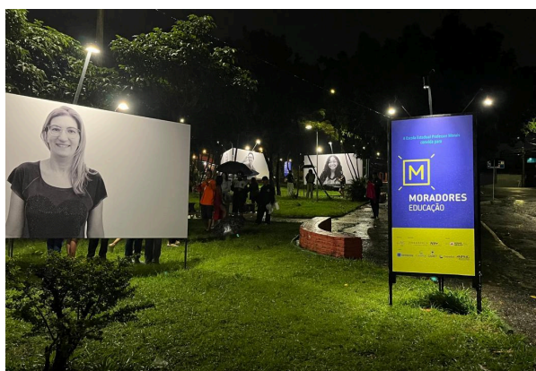
Painéis de fotografias de alunos e ex-alunos instalados na Praça Tejo Data: 03/12/2024

Na chegada à Praça Tejo, em frente à Escola Estadual Professor Morais, a Equipe do Semente pôde observar a instalação dos painéis em grande formato com as fotografias dos alunos e ex-alunos, produtos de uma atividade prevista no Projeto. As atividades estavam programadas para acontecerem na área externa da Escola, na Praça Tejo, mas devido às chuvas intensas, parte da estrutura da cerimônia foi instalada no pátio interno.