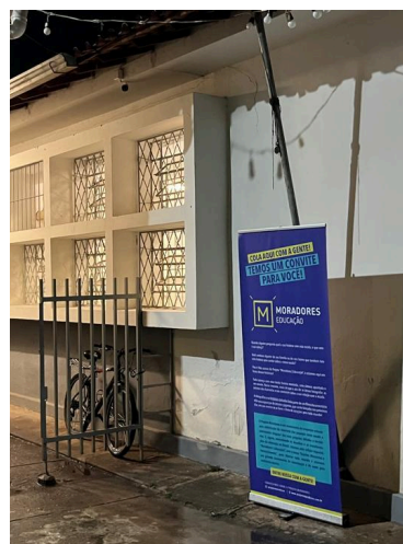
Banner explicativo exposto no pátio de entrada Autoria: Natália Morita Data: 03/12/2024

No corredor das salas de aula havia painéis com fotos dos alunos e dos bastidores das oficinas de gravação e fotografia. As fotos impressas foram disponibilizadas para os alunos levarem para suas casas. No pátio interno, próximo à quadra, estava exposto o “varal de fotos”, com fotos impressas oficiais em preto e branco das pessoas que participaram do Projeto. As fotos impressas estavam sendo distribuídas para os fotografados em uma moldura em papel. O kit educativo distribuído continha a foto, um catálogo do Projeto e ímãs com reprodução das fotos oficiais.