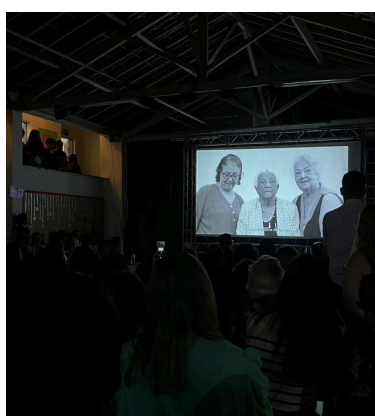
Exibição do documentário produzido no Projeto Autoria: Natália Morita Data: 03/12/2024