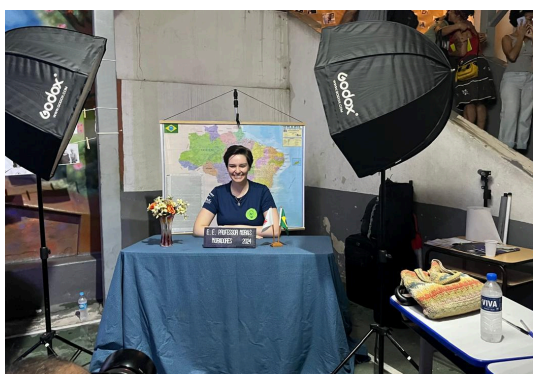
Cenário de fotos montado para participantes do evento Autoria: Natália Morita Data: 03/12/2024

Proteção de Dados Pessoais (LGPD - Lei nº 13.709/2018). Foram coletados os termos de consentimento livre e esclarecido, além das autorizações de uso de imagem. Concomitantemente, eram anotados os dados de identificação e contato da pessoa para o envio da foto tirada durante o evento.