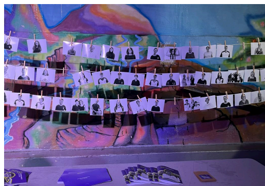
Varal de fotos oficiais dos participantes do Projeto

Data: 03/12/2024